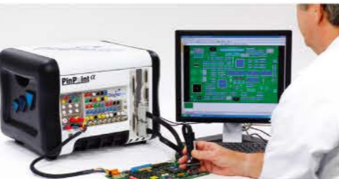
經濟實惠 電路板故障查找