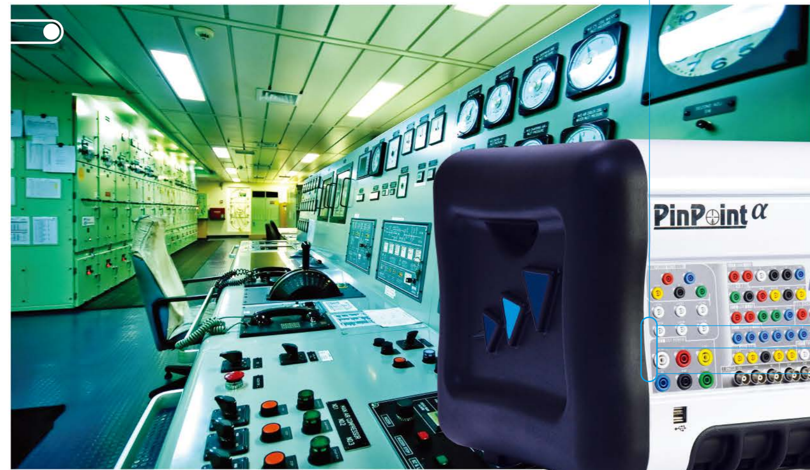
PinPoint Alpha 提供您今日所需功能，同時保護您的預算。

The PinPoint Alpha 系統模塊化，靈活適應性強。提供經濟實惠品質，保證發現故障，PinPoint Alpha 體積小巧便於搬運。保證能隨時隨地提供出色故障篩選、測試和診斷功能。